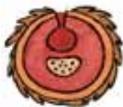
Snittegning af blødende ben