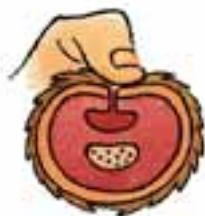
Tryk for at standse blødning